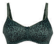
Tonya art 4761X