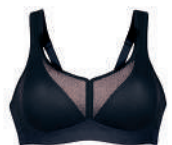
Air control 5744X