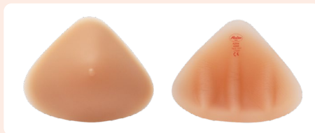
Active 1054 Krūties protezas (tinkantis abiem pusėms)