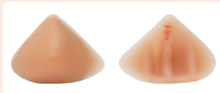
Active Asymmetric 1084 Asimetrinis krūties protezas (kairei arba dešinei pusei)