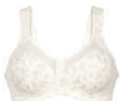
Clara art 4753X