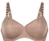
Tonya flair 4706X